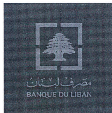
Silver logo 877C