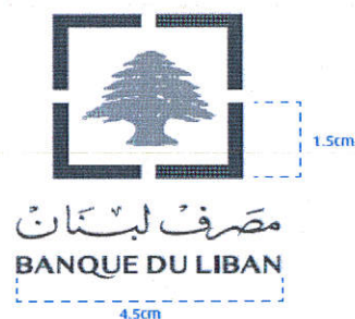
Brandmark specifications (Figure 2)