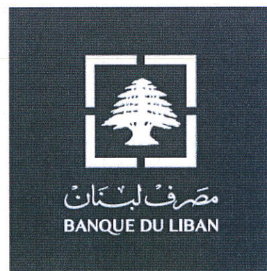
CMYK (white logo)