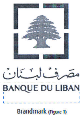
Brandmark (Figure 1)

When printed in CMYK (on ads and publications) the logo becomes white