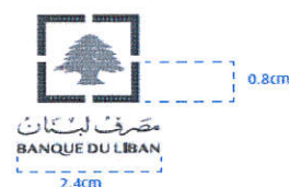
Brandmark specifications (Figure 1)

All dimensions are shown in centimeters.